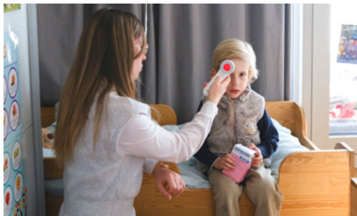
Une garde du Chaperon Rouge intervient auprès d'un enfant malade dont les parents sont au travail.