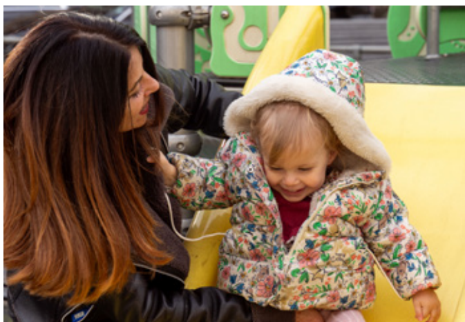
Une garde professionnelle de la Croix-Rouge genevoise joue avec un enfant et assure l'encadrement lorsque le système de prise en charge habituel fait momentanément défaut.

Afin de répondre aux besoins des familles et de garantir le bien-être des enfants, la Croix-Rouge genevoise propose des solutions de garde d'urgence, un service de baby-sitting certifié, des animations pédagogiques et un soutien scolaire adapté. Ces prestations visent à offrir un cadre sécurisé et bienveillant aux enfants tout en soutenant les parents dans leur quotidien.