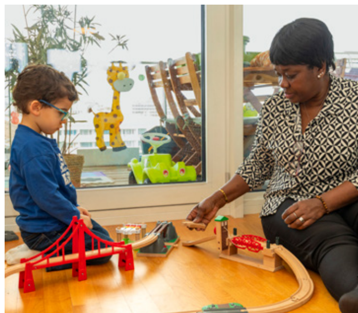
Instant de jeu entre une garde du Chaperon Rouge et un enfant, dans le cadre d'un Bon de respiration, offrant un moment de répit aux parents épuisés.