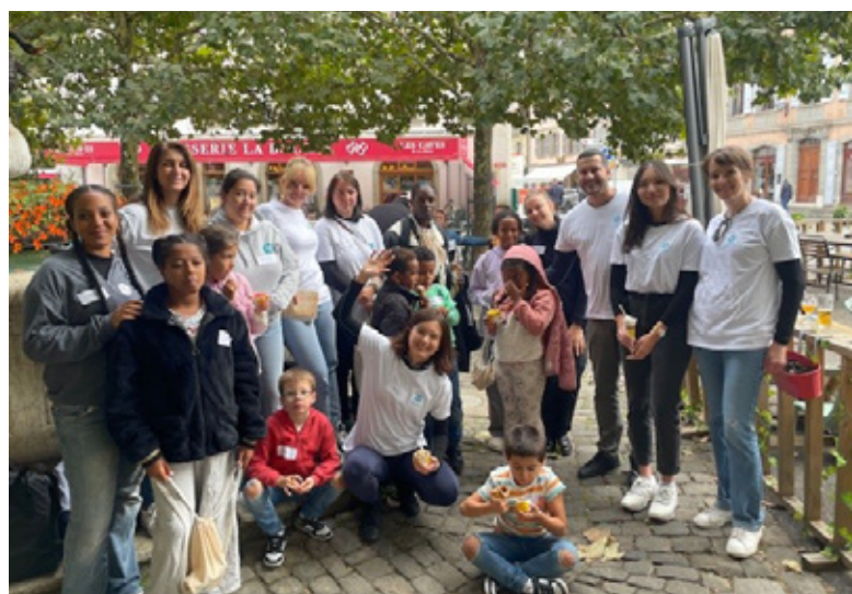
Des enfants bénéficiaires des Mercredis après-midi loisirs durant une «chasse aux glaces» organisée par les bénévoles de l'entreprise Labatec.

Le projet Binômes, quant à lui, est en restructuration, avec un encadrement renforcé et une ambition renouvelée en faveur de l'inclusion des jeunes issu-e-s de la migration. L'optimisation des activités en faveur des enfants défavorisé-e-s a constitué une priorité en 2024. Afin de renforcer l'encadrement, la décision a été prise de réduire en 2025 le nombre d'enfants accueilli-e-s à 25 pour les Journées loisirs et à 16 pour les Mercredis après-midi loisirs. Le calendrier 2025 a également été ajusté: les Journées loisirs se dérouleront sur 7 semaines (contre 10 auparavant), avec une pause lors des périodes de faible disponibilité des moniteurs-trices.