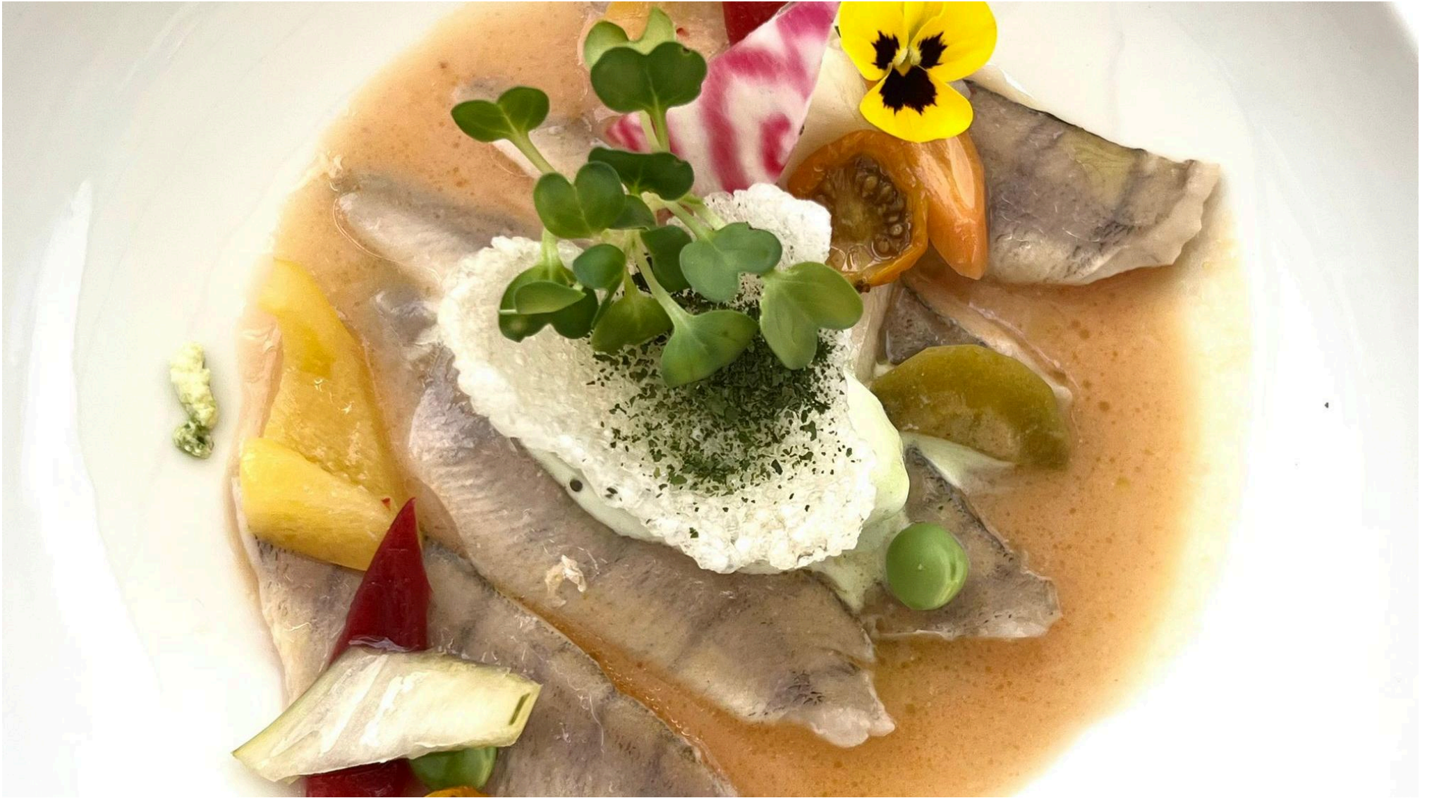
Filets de perche.

Au Tourbillon, elle sublime des filets de perche locaux avec un bouillon de mélisse et vin blanc, rehaussant le tout par un enivrant sorbet à base de tagète, herbe aromatique au goût de fruit de la passion. Sur un lit de carpaccio de tomates genevoises, son turbot s'accompagne de perles de patates, confites au four avec de l'huile d'olive et les herbes aromatiques qu'elle cultive